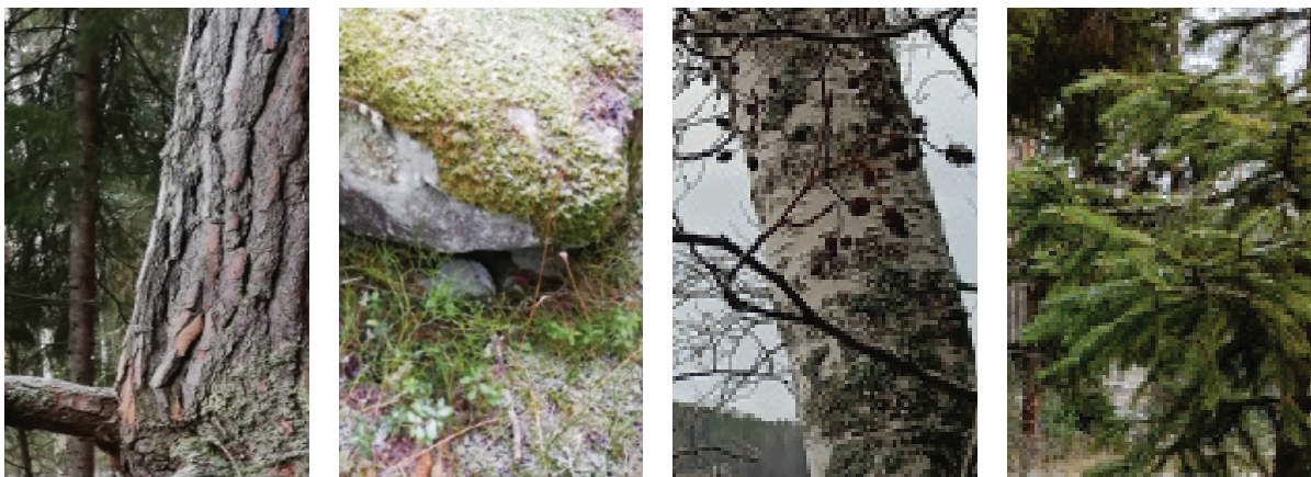
Esimerkkejä ympäröivän luonnon värisävyistä.

Rakennusten värimaailman tulee olla harmoniassa saaren luonnon kanssa, minkä saavuttamiseksi julkisivuverhouksen sävyt poimitaan rakennuspaikkaa ympäröivän luonnon värimaailmasta. Julkisivut tulee käsitellä murretuilla, metsäisillä sävyillä, joko kuulto- tai peittomaaleilla. Myös rautaoksidikäsitelyä voidaan käyttää puun luonnollisen harmaantumisen saavuttamiseksi. Julkisivun tulee pääsääntöisesti olla yhtä pääväriä, jonka rinnalle voidaan valita vähäinen määrä (1–2) tehostevärejä, joita voi käyttää esimerkiksi ovissa, ikkunoissa ja terassirakenteissa. Kirkkaita, huomattavasti julkisivun sävystä poikkeavia tehostevärejä ei sallita, vaan kontrasti näiden kahden välillä tulisi olla vähäinen. Julkisivuverhouksen päälle kiinnitettäviä, julkisivuväristä huomattavasti poikkeavia nurkka-, peite- tai ikkunanpielilautoja eikä pellityksiä sallita. Mustaa tai valkoisen sävyjä ei sallita rakennusten julkisivussa eikä yksityiskohdissa. Tavoitteena on, että alueella käytetään eri julkisivuvärejä sekoittuneesti.